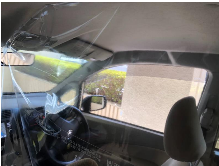
[車内は左右で仕切る、訪問した際患者ごとに消毒]